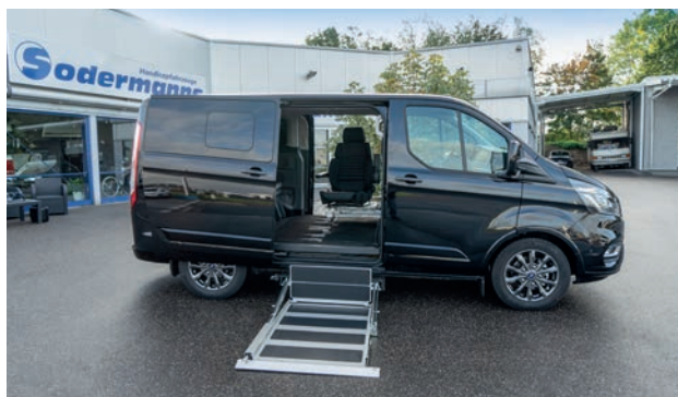
Einfach mit dem Rollstuhl in das Auto hineinfahren