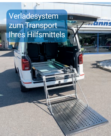
Verladesystem zum Transport Ihres Hilfsmittels