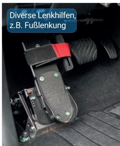
Diverse Lenkhilfen, z.B. Fußlenkung